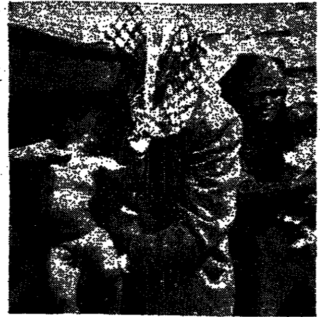
מחירי חושי הדין, פליט מרמת הגולן, מוחזקת אהלו שוחרת

ברית המועצות של ארה"ב היא אבן נשן. נשיא ניקסון אמר כי ארה"ב לא תפנה את כוחותיה מאירופה.